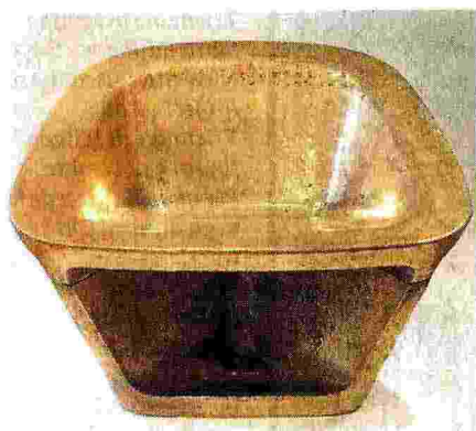
UTILISSIMO | A sinistra in alto Alternatore trifase e monofase, 1956, sotto, Tom Dixon «Cu29», 2006, Rame elettroformato su polistirolo, qui sopra: Lucio Fontana, «Concetto Spaziale. New York, Grattacielo», 1962