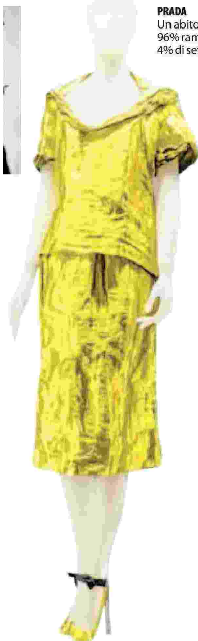
PRADA Un abito di Prada 96% rame smaltato 4% di seta