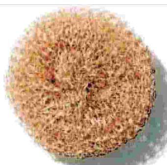
SPUGNA "Copper Sponge", 2011, rame, produzione HAY, diametro 8 centimetri