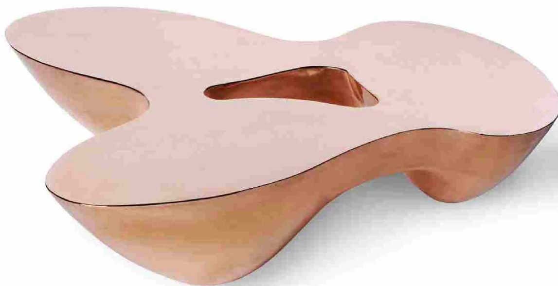
↑ Emmanuel Babled, Quark copper table 30, in 3 elements, 2014, 30 x 83 x 122,5 cm. Collezione privata

Nella sezione dedicata all'architettura, più ristretta ma ugualmente significativa, sono esposti alcuni modellini di progetti di architetti come Herzog & de Meuron, Renzo Piano, Aldo Rossi, Steven Holl Architects e James Stirling. Anche in questo settore sono presenti prestiti provenienti da Fondazione MAXXI, MAXXI Architettura, Roma, Fondazione Aldo Rossi, Milano, Fondazione Renzo Piano, Genova, Studio d'architettura Herzog & de Meuron, Basilea, Steven Holl Architects, New York.