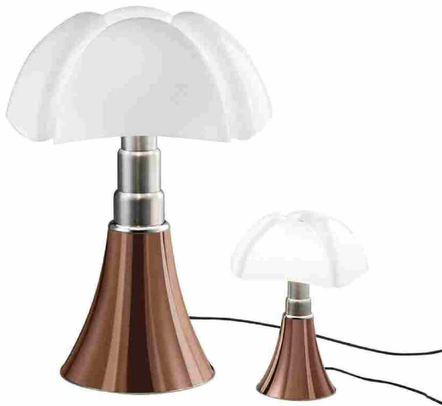
↑ Gae Aulenti, Pipistrello, 1965- 2014, 66/86 x 55 x 55 cm. Collezione privata

Secondo una trama comune affidata al rame, le opere di questi artisti sembrano dialogare tra loro tramite lastre lucide, ossidate o acidate, assemblaggi di fili intrecciati, forme delicate, associazioni inaspettate con altri materiali o parabole riflettenti.