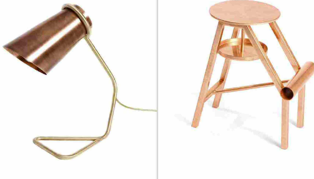
↑ A sinistra: Andrew Clancy, Strand Lamp Small, 2013, 420 x 210 x 250 cm. Collezione privata. A destra: Koichi Futatsumata, Shoe Stool, 2014, 45 x 40 x 25 cm. Collezione privata

Il rame è inoltre impiegato nei più avanzati campi della tecnologia, puro o sotto forma di leghe. Presente in microprocessori e altri componenti elettronici è un materiale fondamentale per l'informatica e le telecomunicazioni. In medicina il rame e i suoi composti venivano impiegati già da Egizi e Greci per l'igiene personale e lo sono tutt'ora grazie alla moderna ricerca sulle loro proprietà antimicrobiche. Nel settore dell'energia, inoltre, il rame è tra i principali e i più efficienti conduttori, compatibile con le tematiche ambientali.